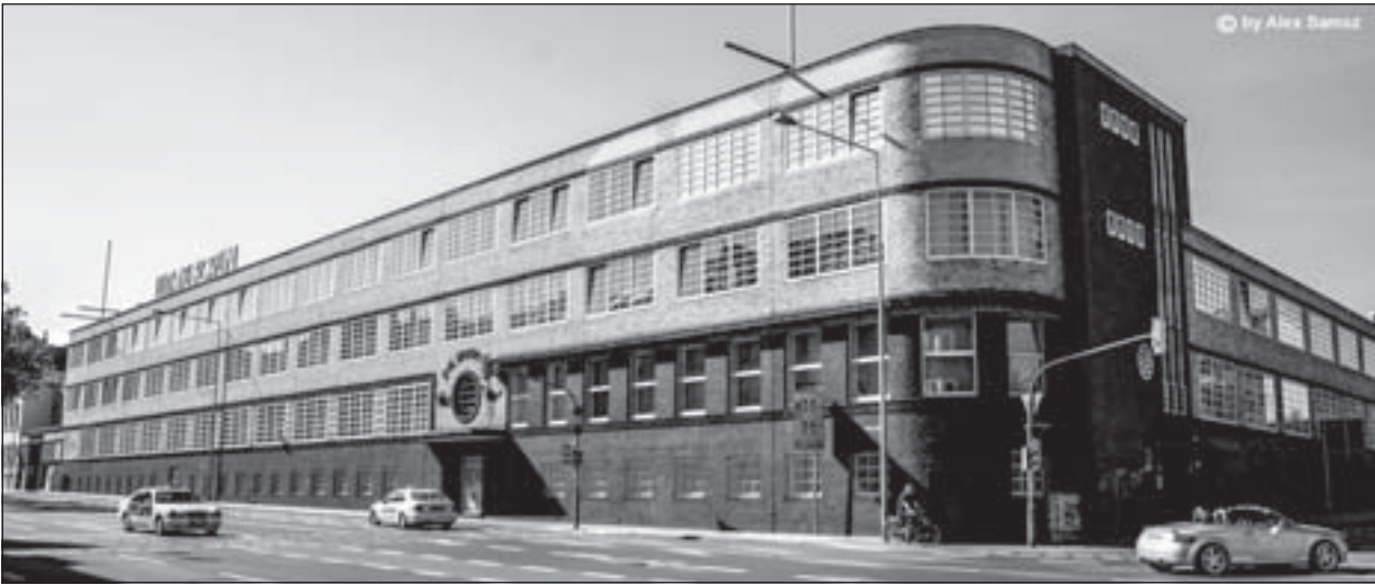
Der Veranstaltungsort der COMICIADE, das Ludwig Forum für Internationale Kunst im Aachener Norden

Der Ablauf ist folgendermaßen geplant: Die COMICIADE besteht aus drei Phasen. Es wird zur Vorbereitung für Schüler und Jugendliche Zeichen- und Schneiderkurse unter professioneller Leitung geben. Diese Kurse werden bereits im Januar 2014 starten.